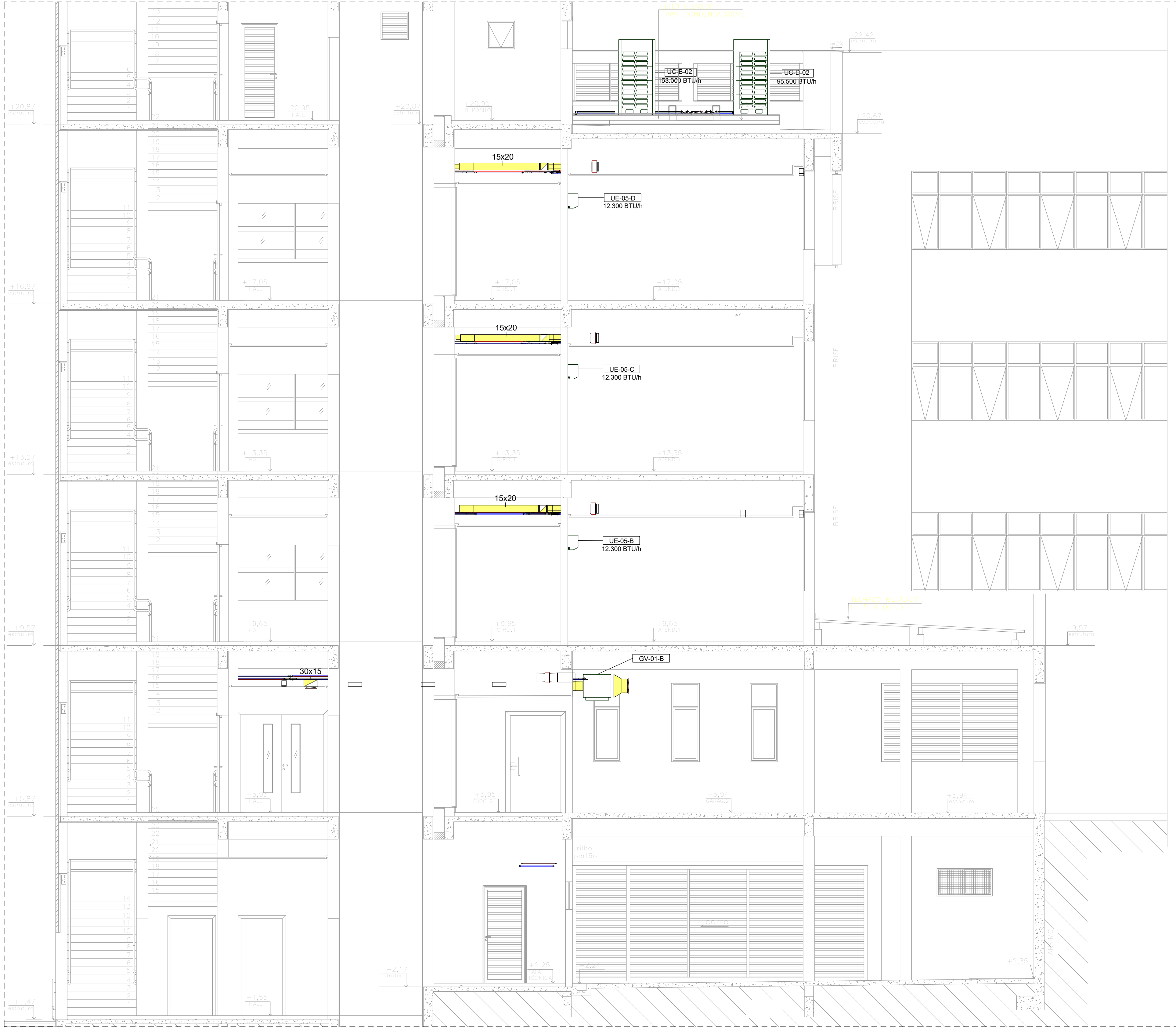
CORTE B-B - AR CONDICIONADO ESC. 1:50